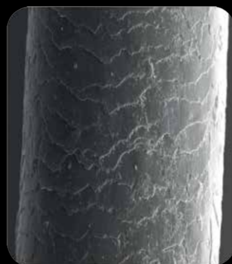
odbarvený vlas s iBLEACHplex